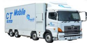
↑16列マルチヘリカルCT搭載車