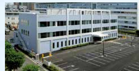
駐車場 (約90台駐車可)