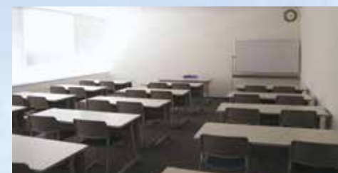
302研修室 (定員28名 58.48㎡)