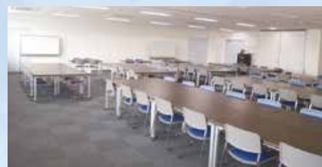
301研修室 (定員98名 220.97㎡)