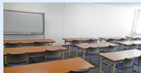
306研修室 (定員30名 63.36㎡)