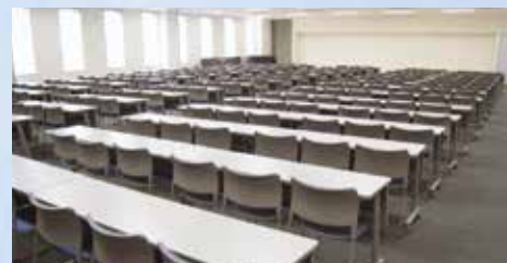
多目的ホール (定員234名 333.18㎡)