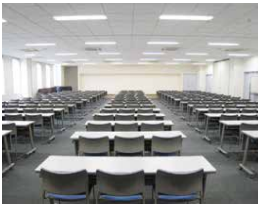
1階多目的ホール(定員234名)