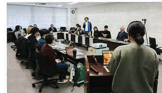
成果発表会の様子