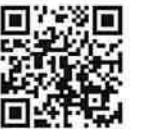
課税取引金額計算書等

「消費税申告」を、オンライン・電話で予約される場合には「課税取引金額計算書等」を別途作成いただくことが必須となります。「課税取引金額計算書等」の書式については当所窓口でお渡しする他、横須賀青色申告会HPでもご確認いただけます。ご不明点ございましたら事務局までご連絡ください。