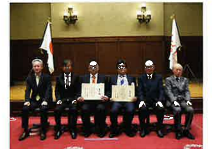
表彰式記念写真 (表彰式2024/11/26 神奈川県庁)