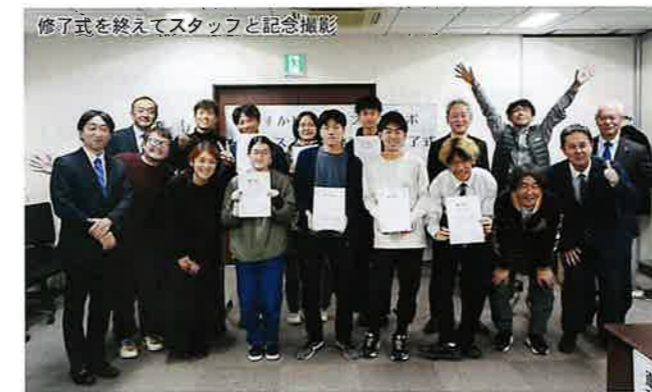
修了式を終えてスタッフと記念撮影

今回は初回開催となりましたが、来年は日本財団ドワンゴ学園が開学するZEN大学とも連携し、大学生の起業を支援する取組もスタートする予定です。当事業を通じて『若者の起業を応援するまち“横須賀”』を全国に発信していきます。事業の詳細は、『よこすかビジネスプランラボ』特集ページをご確認ください。