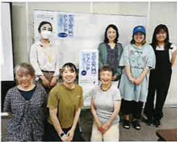
テレワーカー「動画作成研修会」の様子