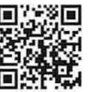
決算・申告相談会

★相談予約時間は40分となります。決算書は事前集計の上お越しください。対応が40分を超える場合、再度予約いただきます。 ★確定申告書に記載する事項に関する各種控除証明書等も忘れずにお持ちください。 ★会計データの確認が必要な場合にはノートPC本体をお持ちください USBメモリでのデータ持込はできません。 ★e-Taxの相談やインボイス・消費税の相談もある方は下記「e-Tax・インボイス等相談コーナー」をご参照ください。