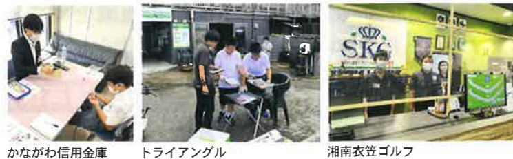
かながわ信用金庫 トライアングル 湘南衣笠ゴルフ

また、夏休み終了後に、この職場体験を経験した6名の学生に対し、『キャリア認定証授与式』を開催いたしました。平松会頭から、職場体験を通じ、身に付けたスキルを記載したキャリア認定証の授与を学生たちに行いました。