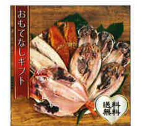
【妙宝水産】 金目鯛、ほっけの入った オススメ干物ギフト