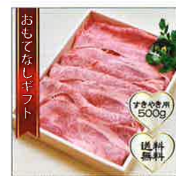
【古敷谷畜産】 葉山牛の肩ロースギフト しゃぶしゃぶセット