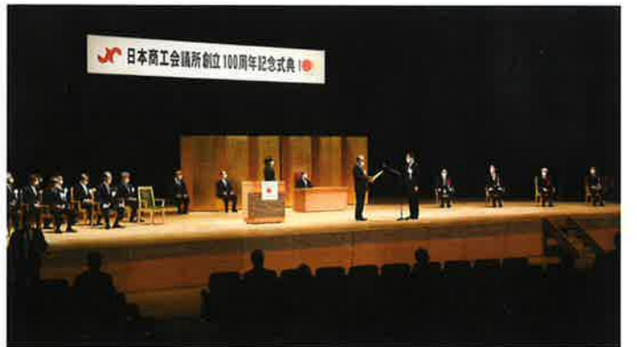
日本商工会議所 創立100周年記念式典会場