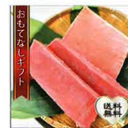
【本まぐる直売所】 天然本まぐる本マグロ 中トロと赤身のセット