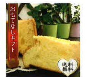
【横須賀シフォン】 選べるシフォンケーキ