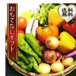
【三浦半島直売所】 三浦半島の畑で作られ た野菜の7種セット