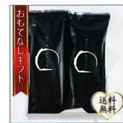
【いづみや】 いづみやのかりんとう饅頭