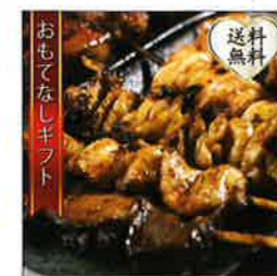
【炭火やきとり にのみや】 人気のやきとり10種類 ×6本計60本セット