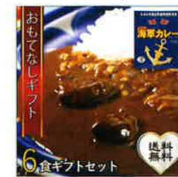
【調味商事】 よこすか海軍カレー ネイビーブルー (6食ギフトセット)