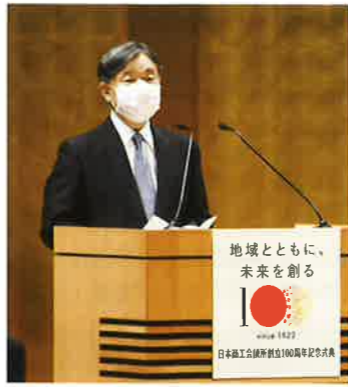
天皇陛下のおことば