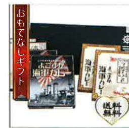
【ヤチヨ】 地域カレーで人気の 横須賀海軍カレーセット