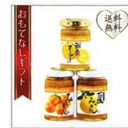
【新倉さんちの手づくりジャム】 三浦半島の柑橘類3個セット