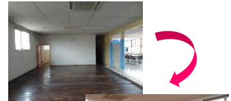
休憩室や食堂等の整備に係る建物附属設備等が対象に